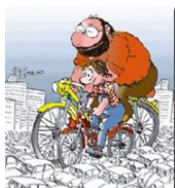
AMICI della BICICLETTA TRENTO