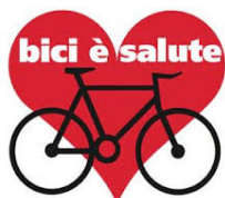
In bici sto bene, e sta bene anche l'ambiente