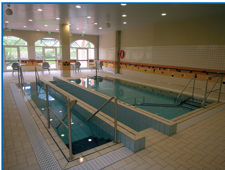
Centro servizi Povo