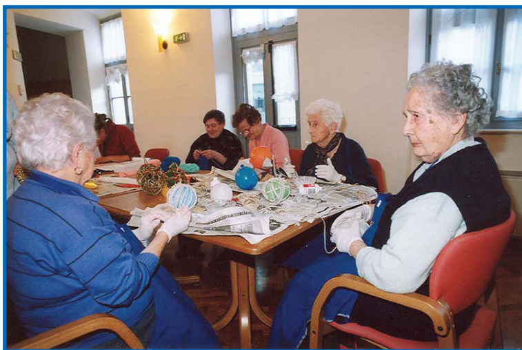
Centro diurno Gardolo