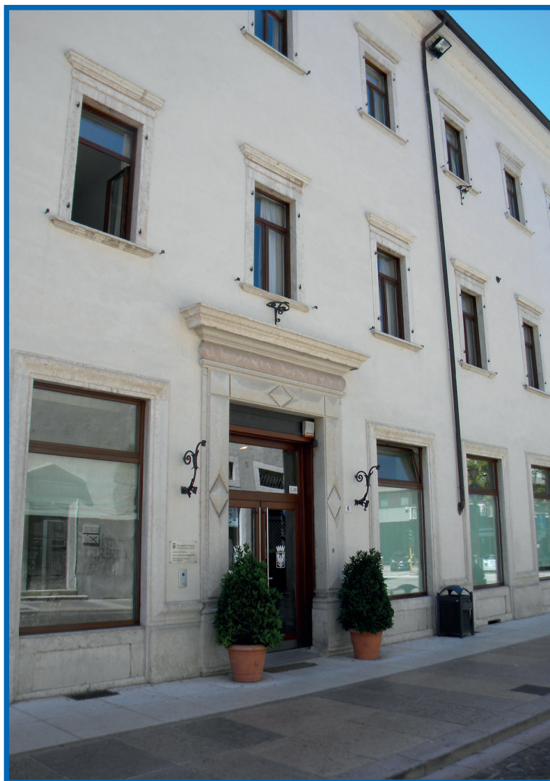
La sede del Servizio Attività sociali di via Alfieri, 6