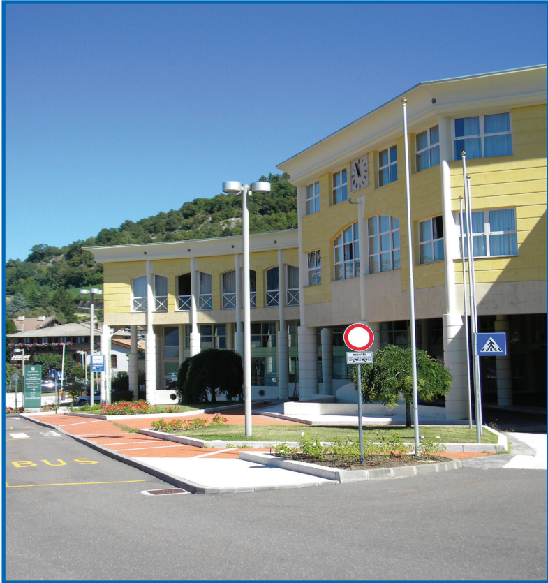
La moderna struttura di Povo ospita vari servizi per anziani