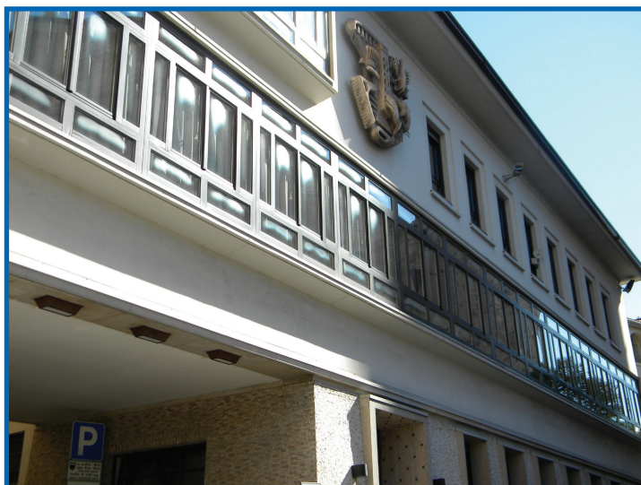
La sede della Fondazione Demarchi

piazza S. Maria Maggiore, 7 - 0461 273611.