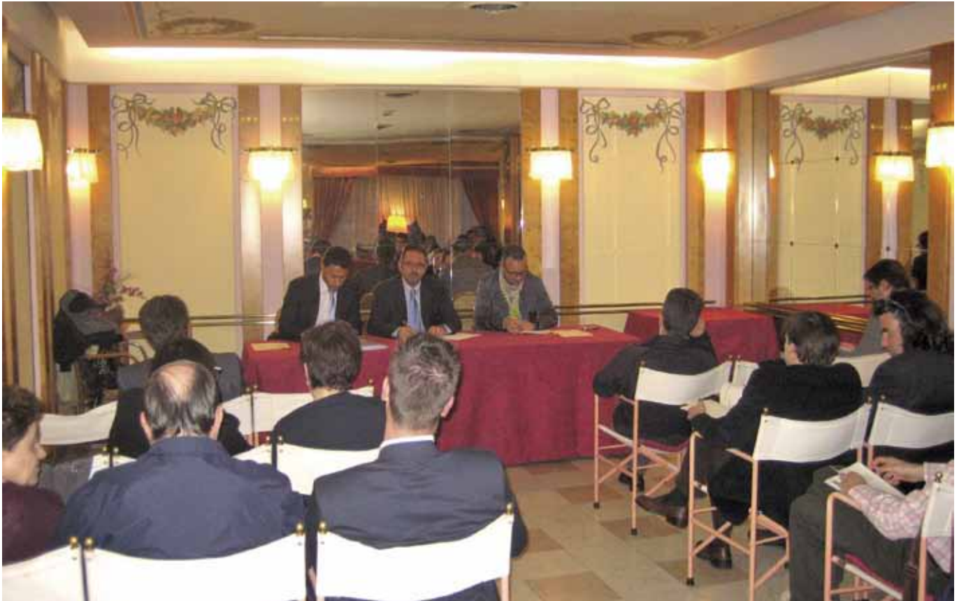
La sala gremita di soci durante l'assemblea

dimostrato innanzitutto dall'adesione dai numerosi operatori della città che con il loro concreto sostegno ci hanno dato di anno in anno la possibilità di mettere in campo una programmazione sempre più oculata delle iniziative, riuscendo a realizzare tutti i nostri progetti di promozione e animazione del centro. Credo che in tal modo Trento Iniziative si sia rivelato un consorzio solido, credibile e affidabile agli occhi degli associati a servizio dei quali ha sempre investito tutte le risorse da noi messe a disposizione.