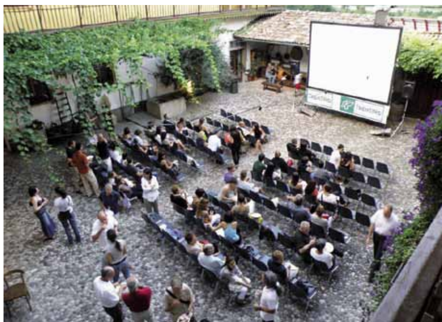
Qualche momento prima della proiezione a Maso de Tarczal

di diventare fan di DOC – Denominazione di Origine Cinematografica – su Facebook. Per informazioni, aprire l'apposita pagina del sito (link: http://blog.enotourtrento.it )