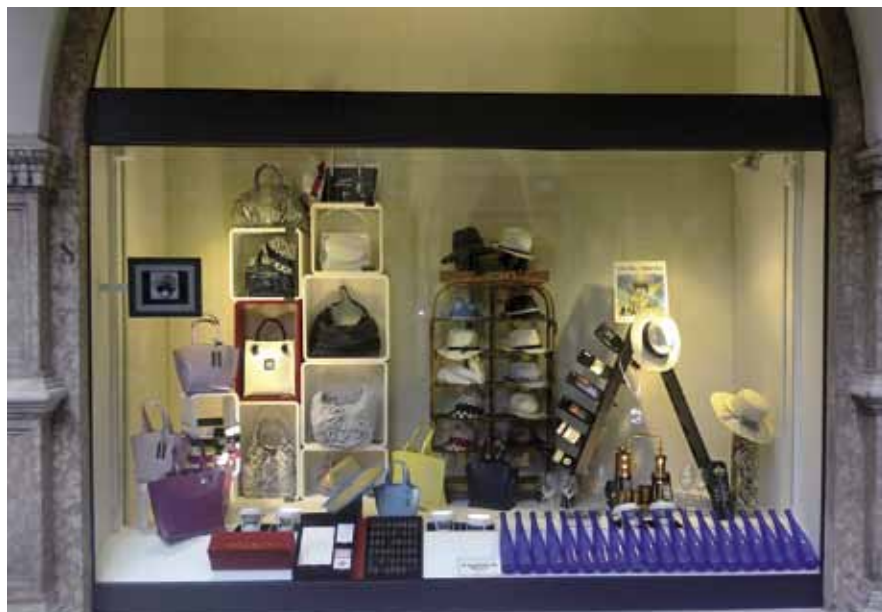
La vetrina della pellicceria Bonfioli

S ono 42 i negozi del centro storico di Trento che hanno accolto l'invito del Cti ad esporre in vetrina, oltre alla propria merceologia, anche oggetti-spia di due eventi importanti della primavera in città. Il primo è andato in scena dal 14 al 17 maggio con la Mostra dei Vini ospitata dal Teatro Sociale e a Palazzo Roccabruna. La partecipazione degli operatori commerciali si è tradotta nell'esposizione nei punti vendita, in modo tale da garantire la visibilità all'esterno, di vini spumanti trentini e di una vetrofania dell'evento. La seconda manifestazione che coinvolgerà le attività distributive del centro andrà dal 3 al 6 giugno e farà da cornice a questa edizione del Festival dell'Economia. Per questo accanto alla vetrofania i negozi daranno visibilità ad uno scoiattolo in legno, simbolo della manifestazione. Questi gli esercizi del centro