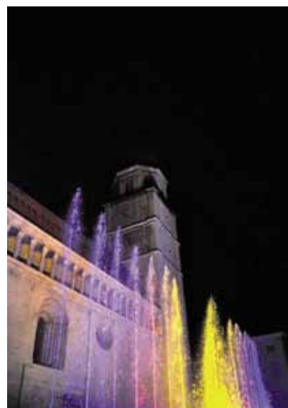
Luci per la festa in Piazza Duomo

La Magica Notte della Danza. Scuole di Danza e gruppi del Trentino propongono una serata di performance, dalla danza moderna all'hip-hop e break dance, dai balli africani al flamenco, dalla danza orientale alla body