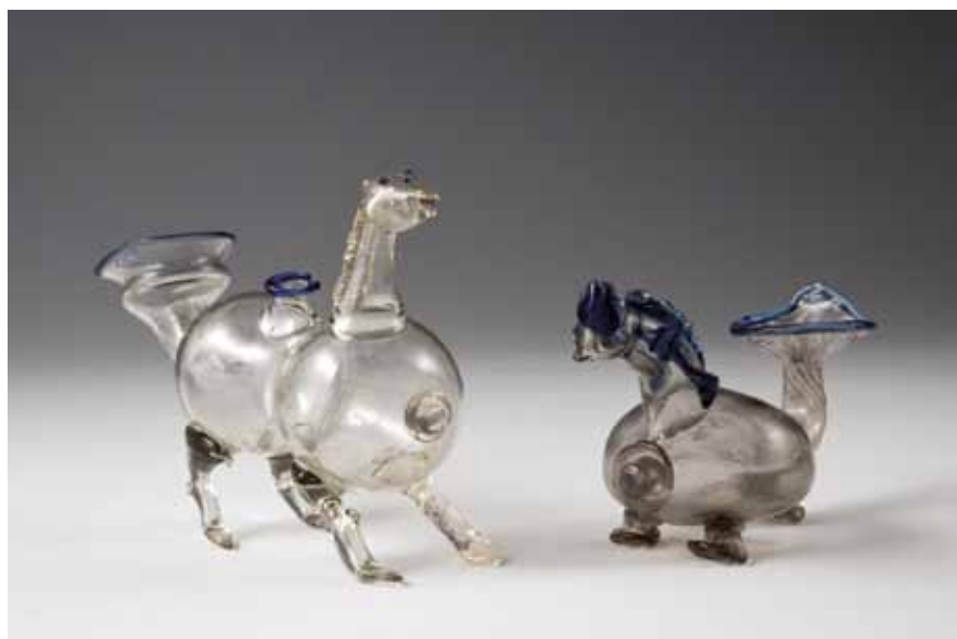
Animali da capriccio. Lucerne a forma di cavalluccio e drago

vedere i reperti affiorare dall'acqua. Non mancheranno filmati dedicati alla lavorazione del vetro e ai capolavori che nascono ogni giorno a Murano. Una ricca e corposa sezione sarà dedicata alle variopinte collane di perle vitree provenienti da collezioni pubbliche e private. Si potranno ammirare le perle a rosetta del XV secolo, le cosiddette "regine delle perle", merce di scambio per acquistare schiavi. Si dice che nel 1626 l'olandese Peter Minnit abbia comprato l'isola di Manhattan dagli indiani per un valore totale di ventiquattro dollari in perle di vetro. Nel mese di agosto ogni giorno sarà anche proposto lo spettacolo teatrale "Glass" messo in scena da L'uovo Teatro Stabile di Innovazione de L'Aquila. La mostra è curata da Aldo Bova.