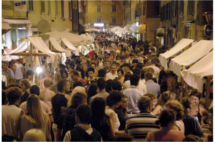
Feste Vigiliane, folla in Borgo San Vigilio

Gli operatori economici del centro concorreranno alla riuscita della Festa in particolare attraverso la partecipazione alla Magica Notte , in occasione della quale i negozi avranno la possibilità di rimanere aperti fino alle 22.30. Deroga ampiamente giustificata dal ricchissimo programma di questo secondo fine settimana e dalla possibilità di divertirsi fino a tardi