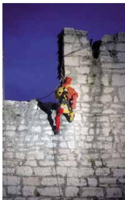
Scalata ai merli di piazza Fiera

ore 18.00-03.00 Alchemica: una notte di musica e magia. Alle 19.30 performance live degli I darpa, viaggio virtuale attraverso differenti cultura musicali con strumenti tradizionali.