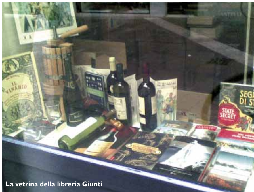
La vetrina della libreria Giunti

Galilei; Erboristeria Santoni e Erboristeria Arnica in via Mazzini; Giacomelli, Disney Trento, Gocce di Luce e Calzature due Leoni in via Suffragio; Faraguna e New Photo in via Pozzo; Profumeria Douglas, Eller, Pretto, Bonfioli e Libreria Giunti in via Oss Mazzurana; Rose e Cose in via Roggia Grande; Selene in via S. Pietro; Mercerie del Centro in via delle Orne; Bonapace e Demattè in via Mancini; Zotta Pelletterie, Alla Rotonda, Single, La Rivisteria in via S. Vigilio; Meroni Camiceria in via Garibaldi; Prealpina, Gioielleria del Simonino, Zanella, Calaresu Intimo e Boutique Swarowski in via S. Simonino; Blu Service in via Cavour; Etich e Ingram Zampiero in Largo Carducci; Duomo Center in via Dordi; Paranà e Frizzi e Lazzi in via Diaz; Grigoli in via Malpaga e Bressan in via Torre Verde.