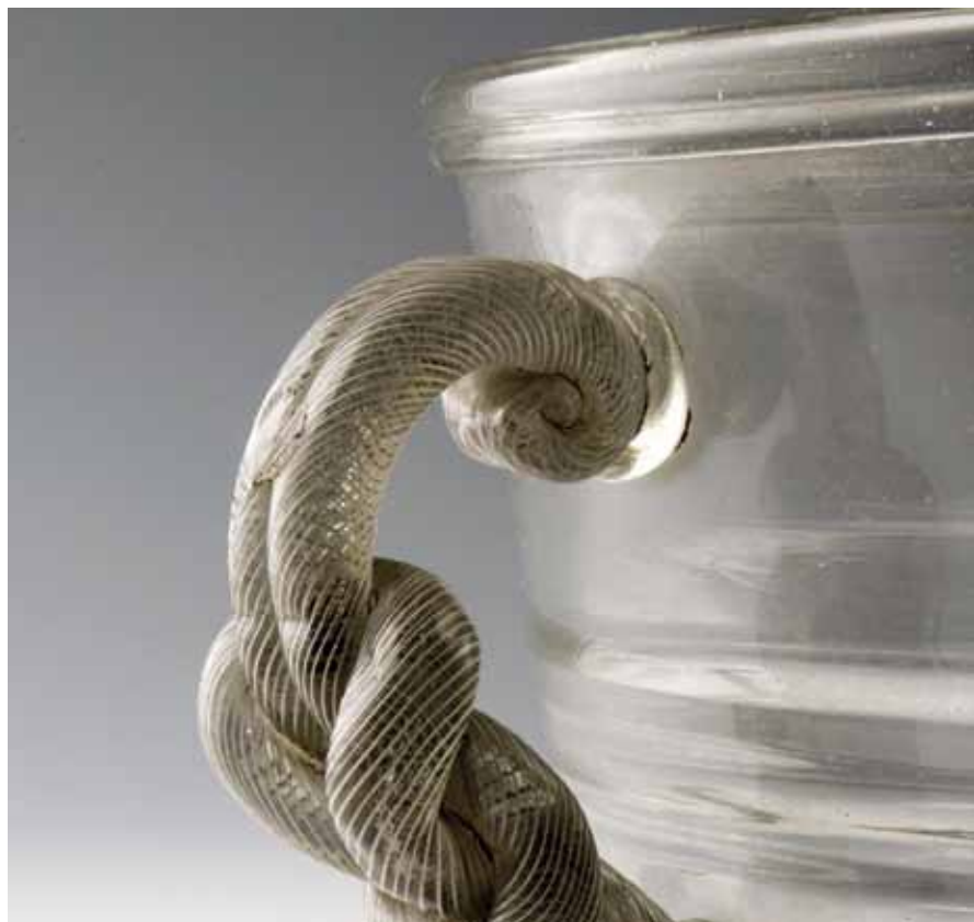
Grande bacile da vino o rinfrescoio - Museo del vetro di Murano

anche aspetti salienti della tecnica e degli stili quando, in epoca rinascimentale, le officine dei vetrai muranesi influenzarono la storia del vetro europeo grazie anche alle nuove scoperte del cristallino, del lattimo e del calcedonio e di tecniche innovative come la filigrana a reticello e a retortoli.