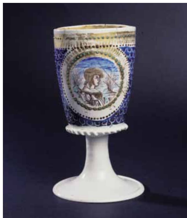
Calice in vetro lattimo (Murano, primo decennio del sec.) Museo Castello del Buonconsiglio

I buoni omaggio sono in distribuzione in tutti punti vendita (negozi, bar, ristoranti) del centro storico nei quali si trova esposta la locandina riprodotta nella pagina a fianco. Ancora una volta gli operatori economici del centro storico dimostrano di voler concorrere in tal modo alla valorizzazione turistica della città. L'offerta del Cti è sostenuta da Servizi Imprese e dal sito Trentoblog.it